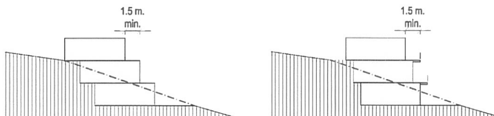
Figures 1 et 2 : bâtiments échelonnés ou en terrasses à 3 corps

Les dispositions suivantes sont à respecter impérativement dans les zones d'affectation suivantes :